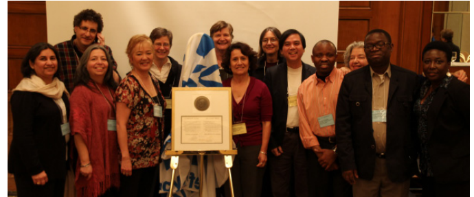
La médaille Nansen inspire les Canadiens à l'action depuis 25 ans.

« Toutefois, comme une organisation réputée [le Conseil canadien pour les réfugiés] avait porté à l'attention du ministre un bon nombre de problèmes similaires provenant du même bureau des visas, le bon sens et le souci d'équité m'amènent à conclure qu'il aurait dû prendre les plaintes davantage au sérieux. »