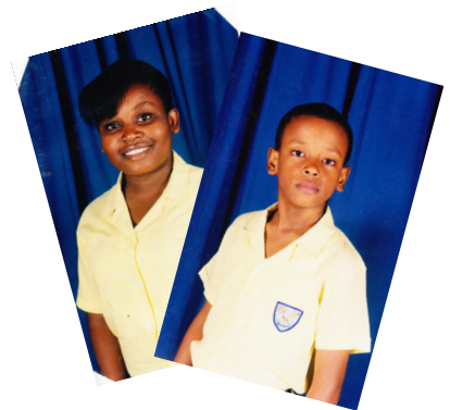
Le CCR a souligné la situation des enfants d'Eline en poussant les autorités à agir rapidement pour réunir les familles séparées suite au tremblement de terre en Haïti en janvier 2010.